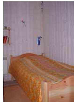
Kinder- schlaf- raum